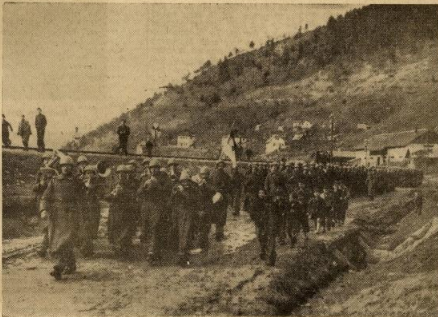
Добровољци на домаку Прибоја...

комунистичке опасности. Српски народ је прогледао.